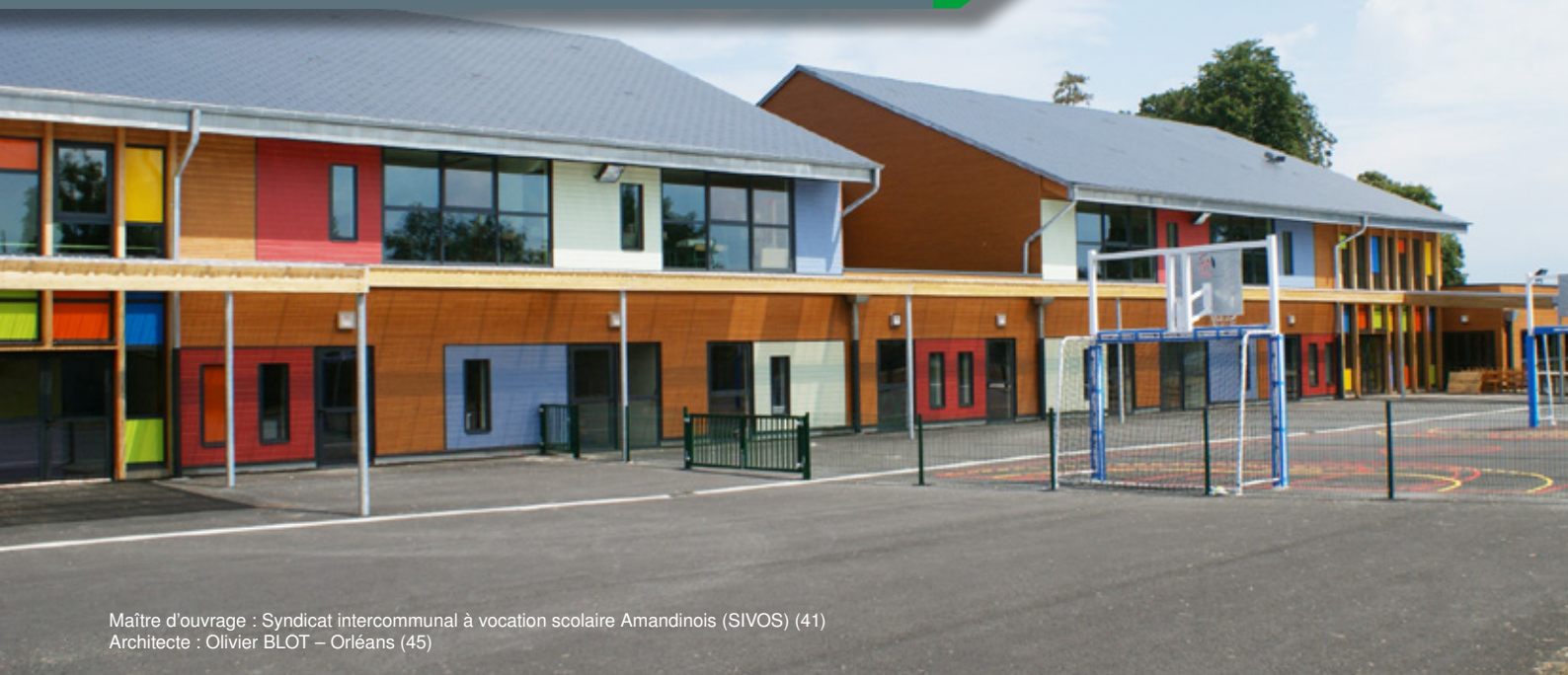
Maître d'ouvrage : Syndicat intercommunal à vocation scolaire Amandinois (SIVOS) (41) Architecte : Olivier BLOT – Orléans (45)

GRUPE SCOLAIRE « MATERNELLE ET ÉLÉMENTAIRE » À ST AMAND LONGPRÉ (41)