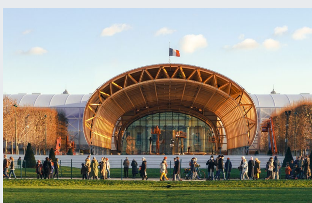
GRAND PALAIS ÉPHÉMÈRE Paris (75)