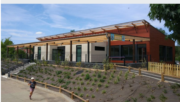
CLSH MONOPENTE® Huisseau-sur-Cosson (41)