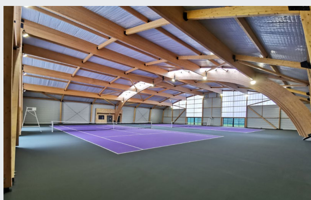
TENNIS COUVERT AVIO® Noiseau (94)