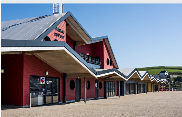
PORT DIELETTE Les Pieux (50)