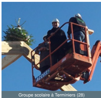
Groupe scolaire à Terminiers (28)

Alors que le chantier se déroule dans de bonnes conditions et à un bon rythme, il est de tradition de procéder à la cérémonie du sapin. À cette occasion, un sapin est hissé sur la toiture pour marquer la pose de la charpente. Une tradition ancestrale qui a pour origine le compagnonnage. Et à en croire les charpentiers alsaciens, cette tradition est un signe de bon présage pour l'avenir.