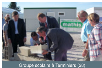
Groupe scolaire à Terminiers (28)

Comment créer l'événement en trois étapes.