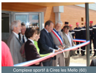
Complexe sportif à Cires les Mello (60)