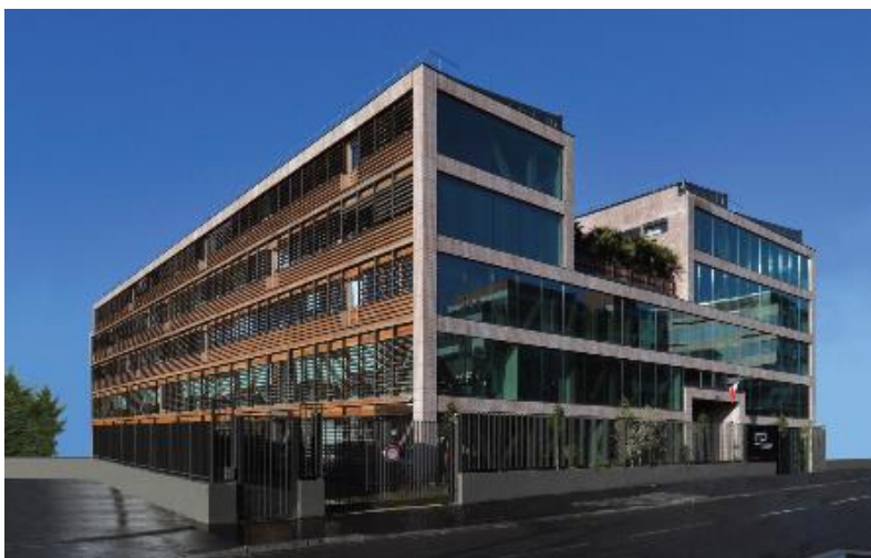
Immeuble de bureaux « Phénomène+ » - Siège de l'INPI à Courbevoie (92)

Grand Prix Simi 2012 pour la construction de l'immeuble de bureaux à ossature bois et énergie positive « Phénomène+ » à Courbevoie (92), nouveau siège de l'INPI.