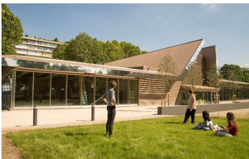
Complexe sportif et de loisirs du stade Suchet à Paris (75)

Toujours en 2016, Mathis construit le complexe sportif et de loisirs du stade Suchet à Paris (75) . Ce bâtiment de R-1 à R+1, semi-enterré sur les 2/3 est un bel exemple du « tout bois ». Toute la diversité des systèmes constructifs bois (bois lamellé-collé, murs et planchers CLT, ossature bois) et leurs différentes combinaisons possibles permettent de répondre aux défis architecturaux avec un sens du détail et des niveaux de finition remarquables, pour une parfaite intégration environnementale.