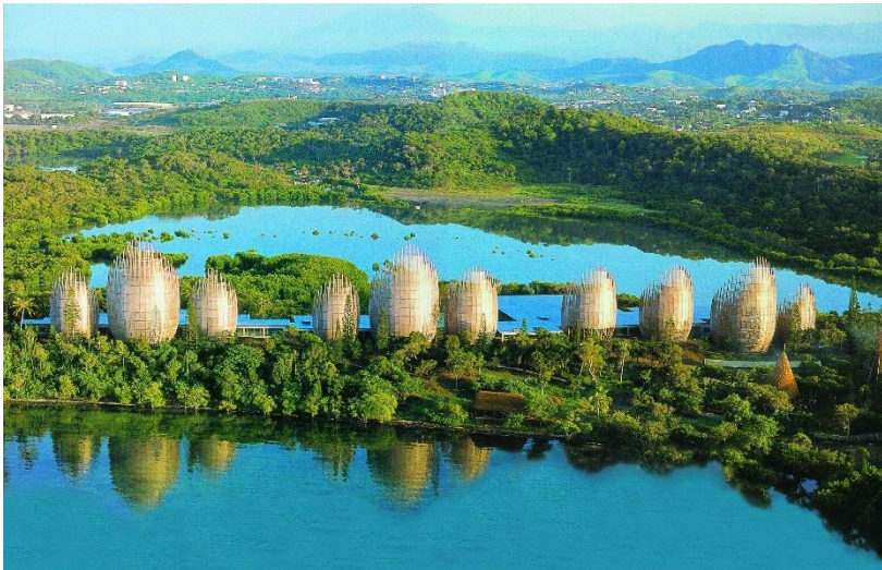
Centre culturel Jean-Marie Tjibaou de Nouméa