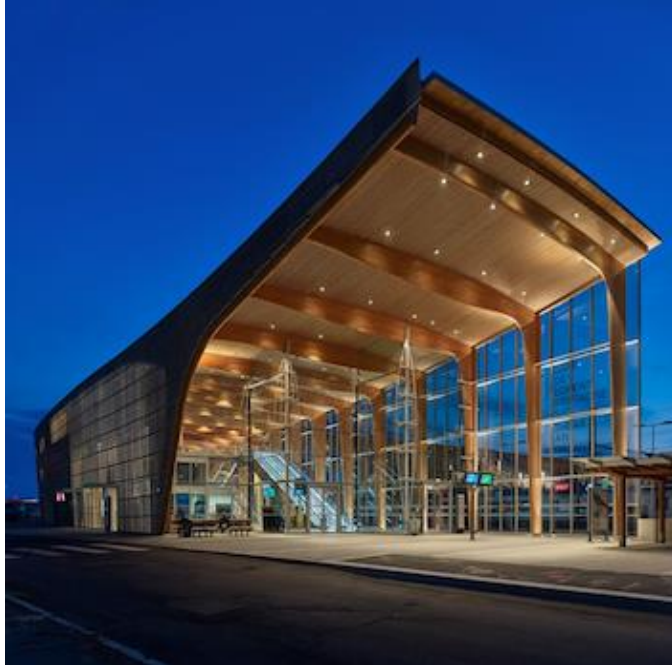
Pôle d'échanges multimodal - Gare TGV de Lorient Bretagne Sud (56)

De 2016 à 2018, Mathis réalise la nouvelle gare TGV de Lorient Bretagne Sud . Ce pôle d'échanges multimodal fait la part belle au bois, omniprésent dans tous les bâtiments : bâtiment voyageur, bâtiment tiers, passerelle, gare routière interurbaine.