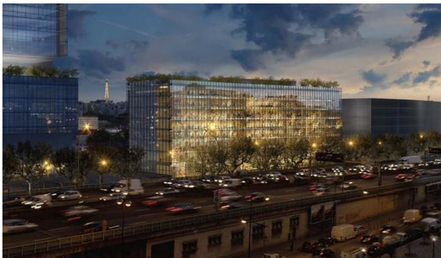
Architecte : Corinne Vezzoni & Associés - Promoteur : Icade Immobilier

Un immeuble R+7 avec 10655 m 2 de bureaux, labellisé HQE ® Excellent, BREEAM Excellent, Effinergie+ et Biosourcé.