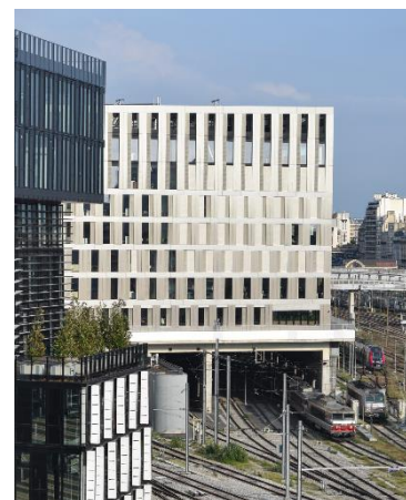
Architectes : Baumschlager Eberle – Scape - Promoteur : Bouygues Immobilier