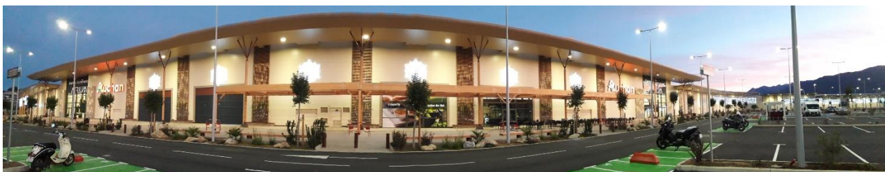
Complexe commercial à Sarrola Carcopino (2A)