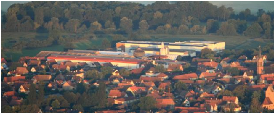
Vue aérienne du site alsacien

Sur un site de 6 hectares, l'ensemble des surfaces couvertes est de 17 000 m 2 , les bâtiments sont équipés de ponts roulants. Les bureaux totalisent 1 600 m 2 répartis sur plusieurs sites. Tous les bâtiments sont chauffés au bois.