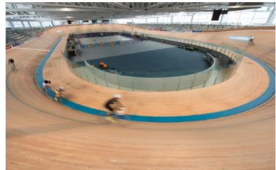
Le vélodrome de Roubaix (59)