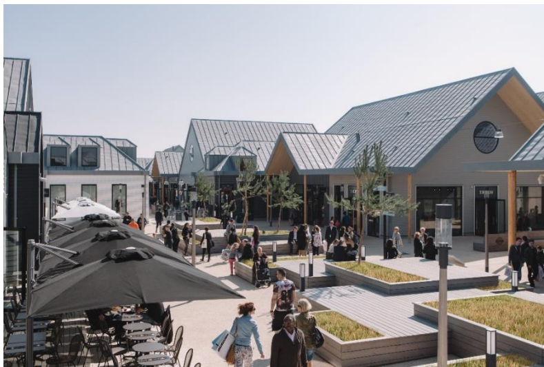
Complexe commercial Marques Avenue A13 à Aubergenville (78)