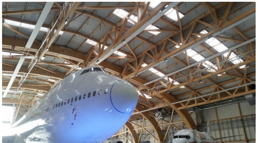
Hangar pour Boeing 747 de l'aéroport international de Bâle/Mulhouse