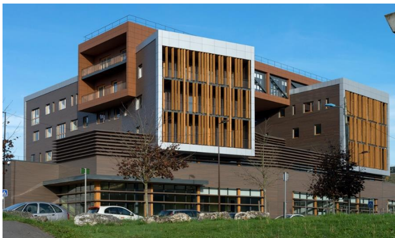
Institut technologique FCBA à Champs-sur-Marne (77)

En 2014, Mathis a notamment réalisé les structures bois du nouveau siège de l'Institut technologique FCBA à Champs-sur-Marne, centre technique industriel, au service des filières forêt, bois-construction et ameublement.