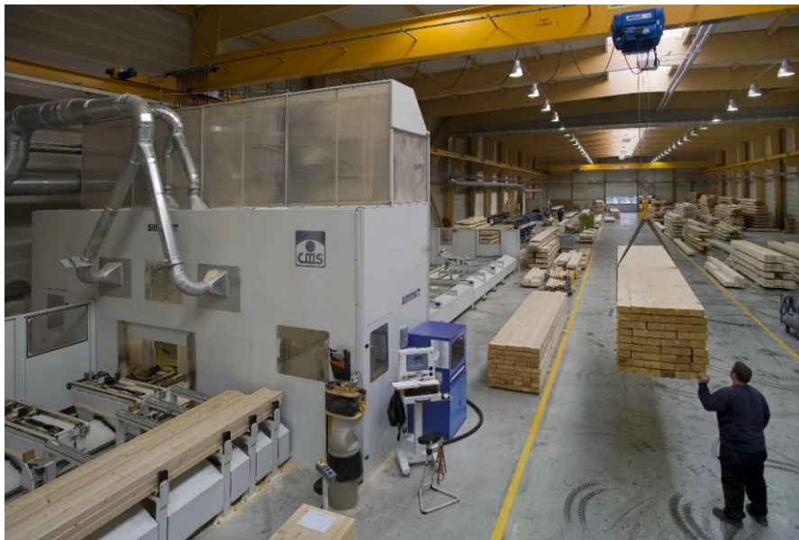
Un des 4 robots d'usinage dans l'usine alsacienne

Les opérations de finition de traitement et d'emballage des éléments produits sont faites par nos équipes de Compagnons.