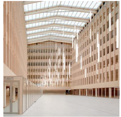
Architecte : Fassio Viaud architectes - Promoteur : Icade Immobilier