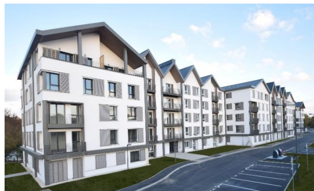
Complexe résidentiel « Quai de la Borde » à Ris-Orangis (91)

Toujours en 2016, Mathis construit le complexe sportif et de loisirs du stade Suchet à Paris (75) . Ce bâtiment de R-1 à R+1, semi-enterré sur les 2/3 est un bel exemple du « tout bois ». Toute la diversité des systèmes constructifs bois (bois lamellé-collé, murs et planchers CLT, ossature bois) et leurs différentes combinaisons possibles permettent de répondre aux défis architecturaux avec un sens du détail et des niveaux de finition remarquables, pour une parfaite intégration environnementale.